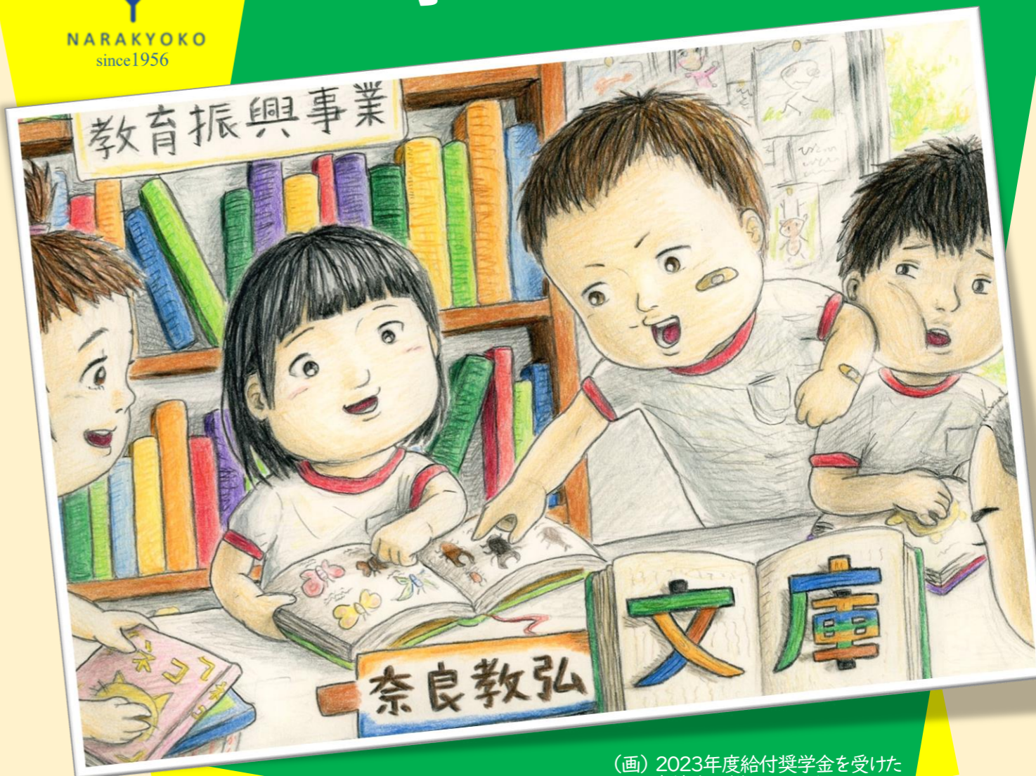
(画) 2023年度給付奨学金を受けた高校生が描いてくれました。

日本教育公務員弘済会(日教弘)は、1952年創立の歴史と伝統を持つ公益法人です。