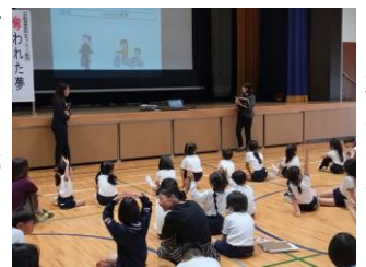
榛原西小学校低学年

用安全五則を講義した。授業を受けた高学年の子どもからは、「自転車を正しく利用しないと自分や被害者だけでなく、家族の夢を奪うということを知って恐ろしいと思いました。絶対気をつけようと思いました。僕の自転車にはライトが付いてないので絶対に付けてもらおうと思った。」低学年の子どもからも「ちゃんとヘルメットをかぶる。気をつけて自転車に乗る」の感想が寄せられた。